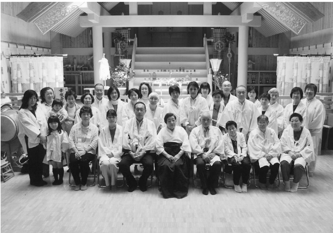
5月の年祭より、会長先生を囲んで

七月二十六日(日)は水子冥福祭です。 最近では、中絶について も低年齢化の傾向にある様 で、深刻な社会問題の一つ であると言えます。