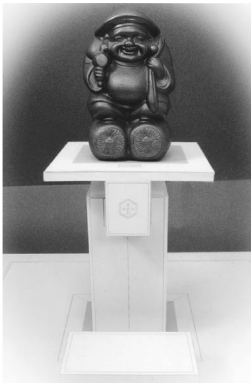
関西支部員 高橋 満様 イメージ構成