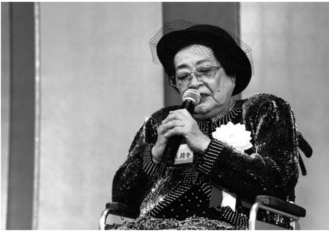
35周年祭、会長先生傘寿の祝いにて