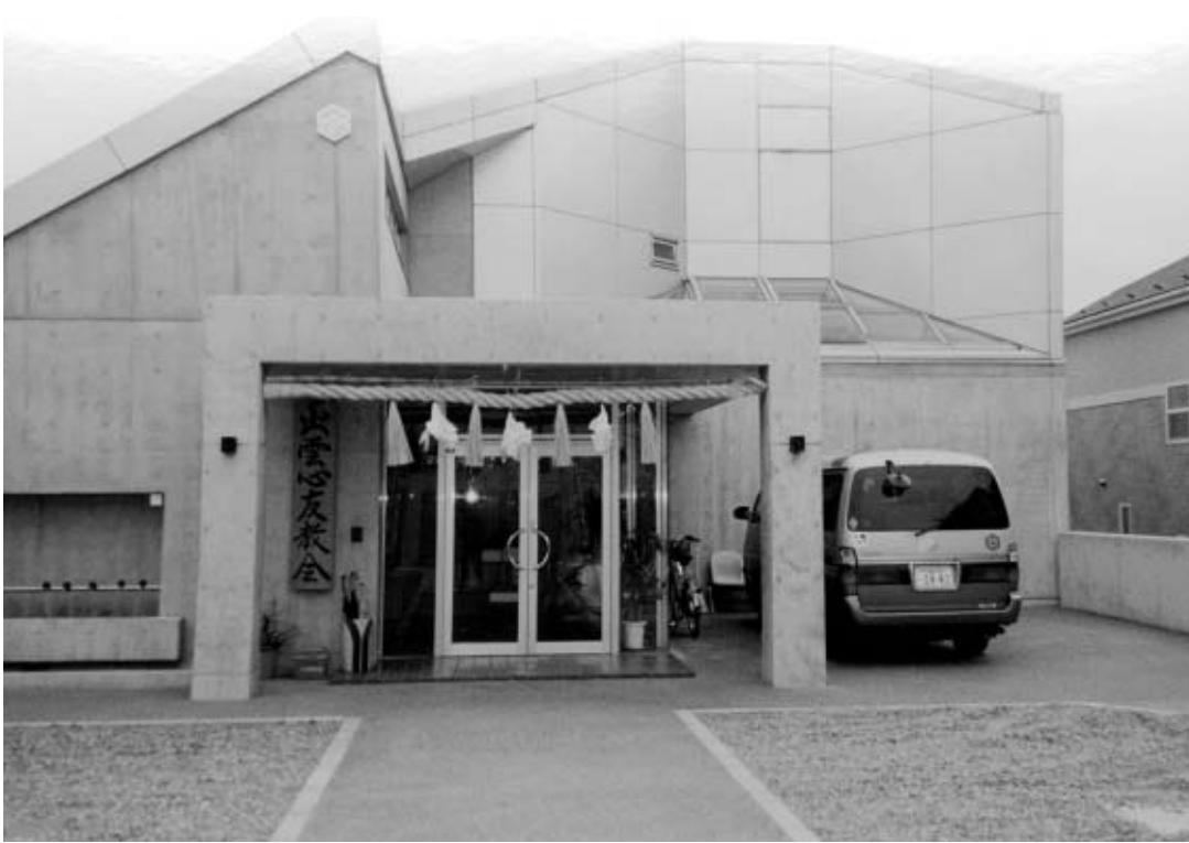
出雲心友教会、本殿の外観

今年も大祓祭が近づいて まいりました。 大祓祭は、我が国上代か ら行なわれている祓式で、 大祓の「大」とは、公全体 を祓うという意味で、これ