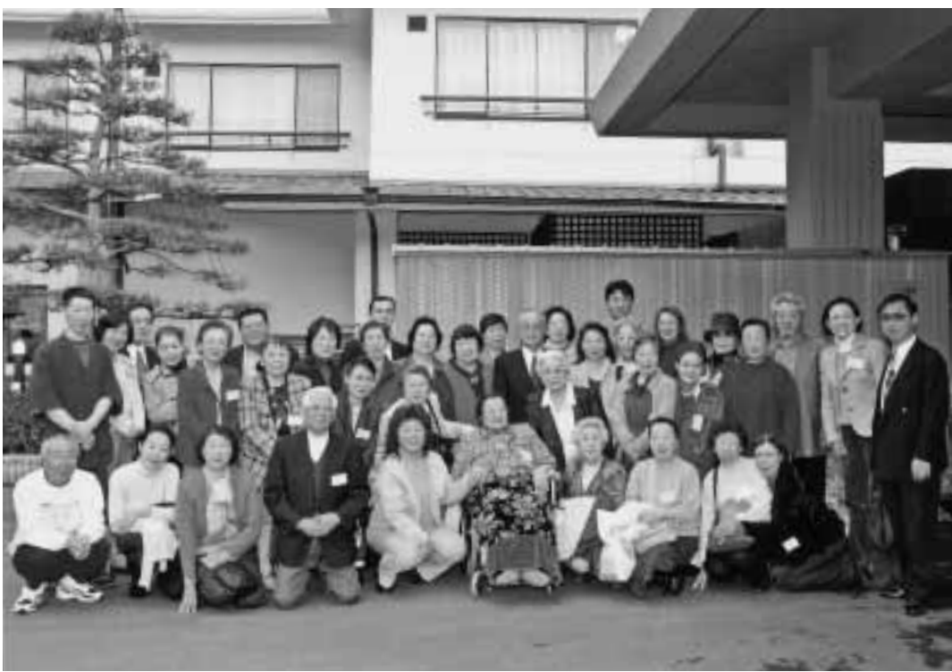
お花見旅行 ～ 群馬 ～

春季例大祭は、大神様からの波長を直接お受けになれる数少ないチャンスの日でもあります。(年間五日ありますが、その内の一日。他には、秋季例大祭と正月